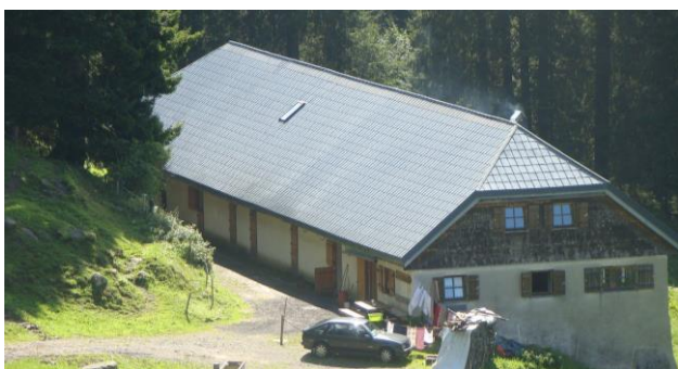
Alphütte Agtenwald auf 1261m Seehöhe im Laternsertal.